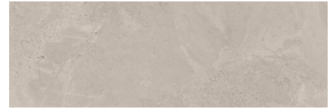
ADVANCE GREY 40X120 - 15,7"X47,2"