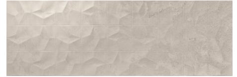
ADVANCE SQUARE GREY 40X120 - 15,7"X47,2"