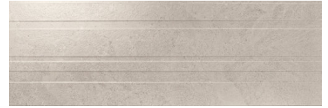
ADVANCE STRIPES GREY 40X120 - 15,7"X47,2"