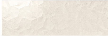
ADVANCE SQUARE WHITE 40X120 - 15,7"X47,2"