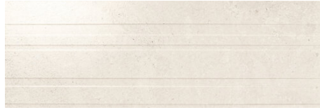
ADVANCE STRIPES WHITE 40X120 - 15,7"X47,2"