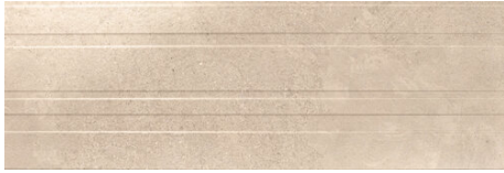
ADVANCE STRIPES BEIGE 40X120 - 15,7"X47,2"