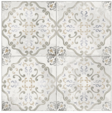
ALICE WHITE 58X58 - 22,8"X22,8"