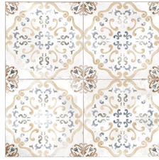
ALICE BEIGE 58X58 - 22,8"X22,8"