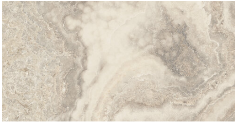
AMERICA BEIGE 62X120 - 24,4\"X47,2\"