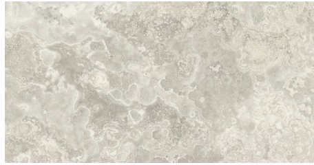
AMERICA PERLA 62X120 - 24,4\"X47,2\"