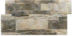
ANDES MIXTO 33,2X66,5 - 13,1"X26,2"