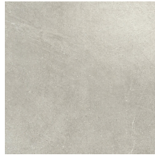
AUSTIN TAUPE 58X58 - 22,8"X22,8"