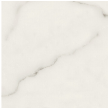
CALACATTA 8 BLANCO 58X58 - 22,8"X22,8"