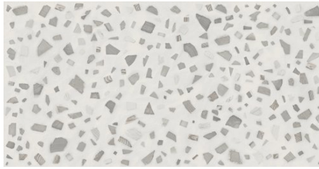
FLORA BLANCO 62X120 - 24,4"X47,2"