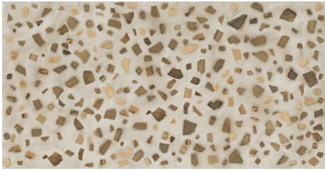
FLORA BEIGE 62X120 - 24,4"X47,2"