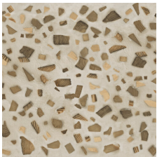
FLORA BEIGE 58X58 - 22,8"X22,8"