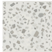
FLORA BLANCO 58X58 - 22,8"X22,8"