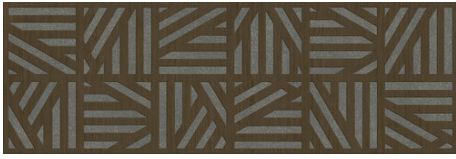
JAZZ MOKA 40X120 - 15,7"X47,2"