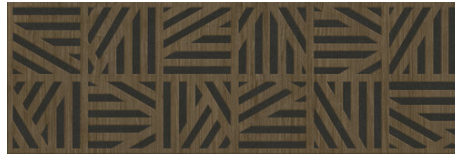
JAZZ NOTTE 40X120 - 15,7"X47,2"