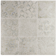
KOTOR PERLA 58X58 - 22,8"X22,8"