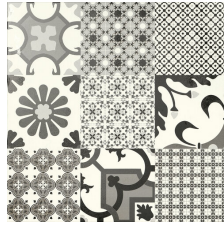
LOGOS NEGRO 58X58 - 22,8"X22,8"