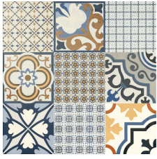
LOGOS AZUL 58X58 - 22,8"X22,8"