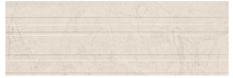
LORENA STRIPES BONE 40X120 - 15,7"x47,2"