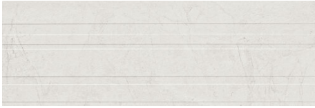
LORENA STRIPES PERLA 40X120 - 15,7"x47,2"