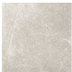
MAESTRAT PERLA 60X60 - 23,6"X23,6"