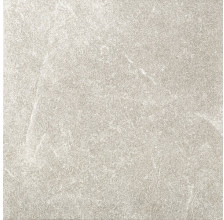
MAESTRAT PERLA 58X58 - 22,8"x22,8"