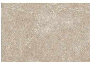
MAESTRAT TIERRA 60X90 - 23,6"X35,4"