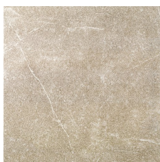
MAESTRAT TIERRA 60X60 - 23,6"X23,6"