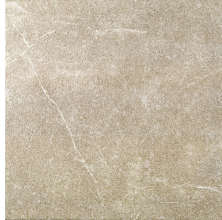
MAESTRAT TIERRA 58X58 - 22,8"x22,8"