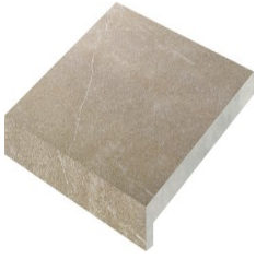
MAESTRAT TIERRA PELDAÑO 60X60 - 23,6"x23,6"