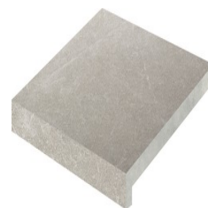
MAESTRAT PERLA PELDAÑO 60X60 - 23,6"X23,6"