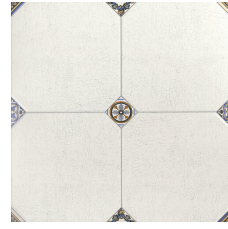
MANISES DECOR BLANCO 58X58 - 22,8"X22,8"