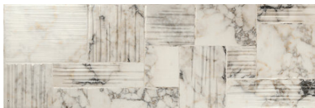
ORLY STICK BLANCO 40X120 - 15,7"X47,2"