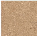
OTEROS CUERO 33,3X33,3 - 13,1"X13,1"