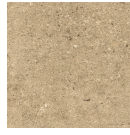
OTEROS BEIGE 33,3X33,3 - 13,1"X13,1"