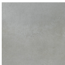
PACIFIC GRIS 58X58 - 22,8"X22,8"