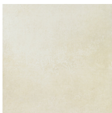
PACIFIC BONE 58X58 - 22,8"X22,8"