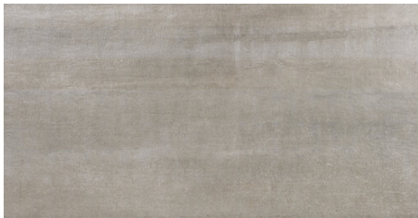
PORTLAND SAGE 62X120 - 24,4"x47,2"