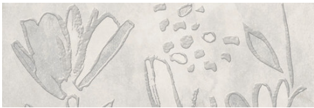
PRADA DECOR PERLA 40X120 - 15,7"x47,2"