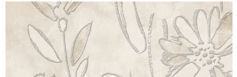
PRADA DECOR BONE 40X120 - 15,7"x47,2"