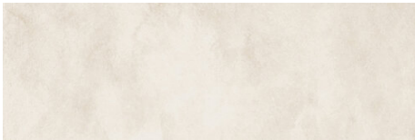
PRADA BASE BONE 40X120 - 15,7"x47,2"