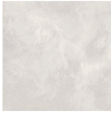
PRADA PERLA 58X58 - 22,8"x22,8"