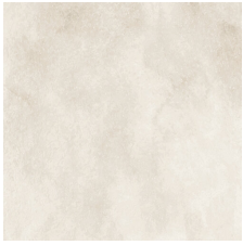
PRADA BONE 58X58 - 22,8"x22,8"