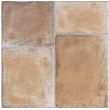
PROVENZA CUERO 58X58 - 22,8"X22,8"