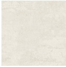
TIKKO BLANCO 58X58 - 22,8"X22,8"