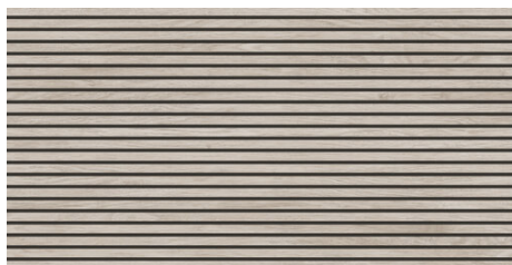
TOKYO PERLA 62X120 - 24,4"X47,2"