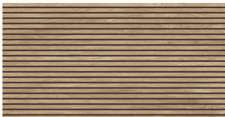
TOKYO BEIGE 62X120 - 24,4"X47,2"