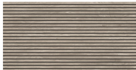
TOKYO GRIS 62X120 - 24,4"X47,2"