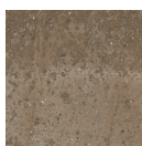
TORMES TIERRA 33,3X33,3 - 13,1"x13,1"