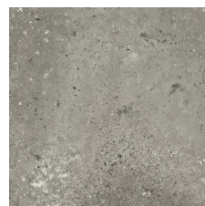
TORMES GRIS 58X58 - 22,8"x22,8"