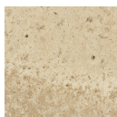
TORMES BEIGE 33,3X33,3 - 13,1"x13,1"