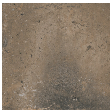
TORMES TIERRA 58X58 - 22,8"x22,8"