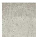
TORMES PERLA 33,3X33,3 - 13,1"x13,1"