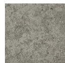
TORMES GRIS 33,3X33,3 - 13,1"x13,1"