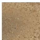
TORMES CUERO 33,3X33,3 - 13,1"x13,1"