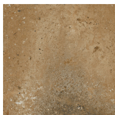
TORMES CUERO 58X58 - 22,8"x22,8"