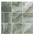
TULUM VERDE 33,3X33,3 - 13,1"X13,1"