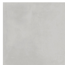
VOGUE ALMOND 58X58 - 22,8"x22,8"